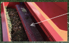
振動ふるい ゴムチップはそのまま落下し、ゴミのみを除去