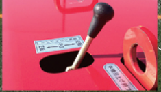
レバーのワンタッチ操作で回転ブラシの正・逆転の切替が可能

ロングパイル人工芝は、55mm前後のパイル丈の人工芝に専用の特殊調整珪砂とゴムチップを充填したものです。人工芝でも使用頻度が増すと繊維カスや落ち葉、芝の倒れやゴムチップの固結によるプレーコンディションの悪化など様々な問題が発生する場合があります。人工芝をいきいきと長持ちさせるためには、定期的なメンテナンスが重要です。