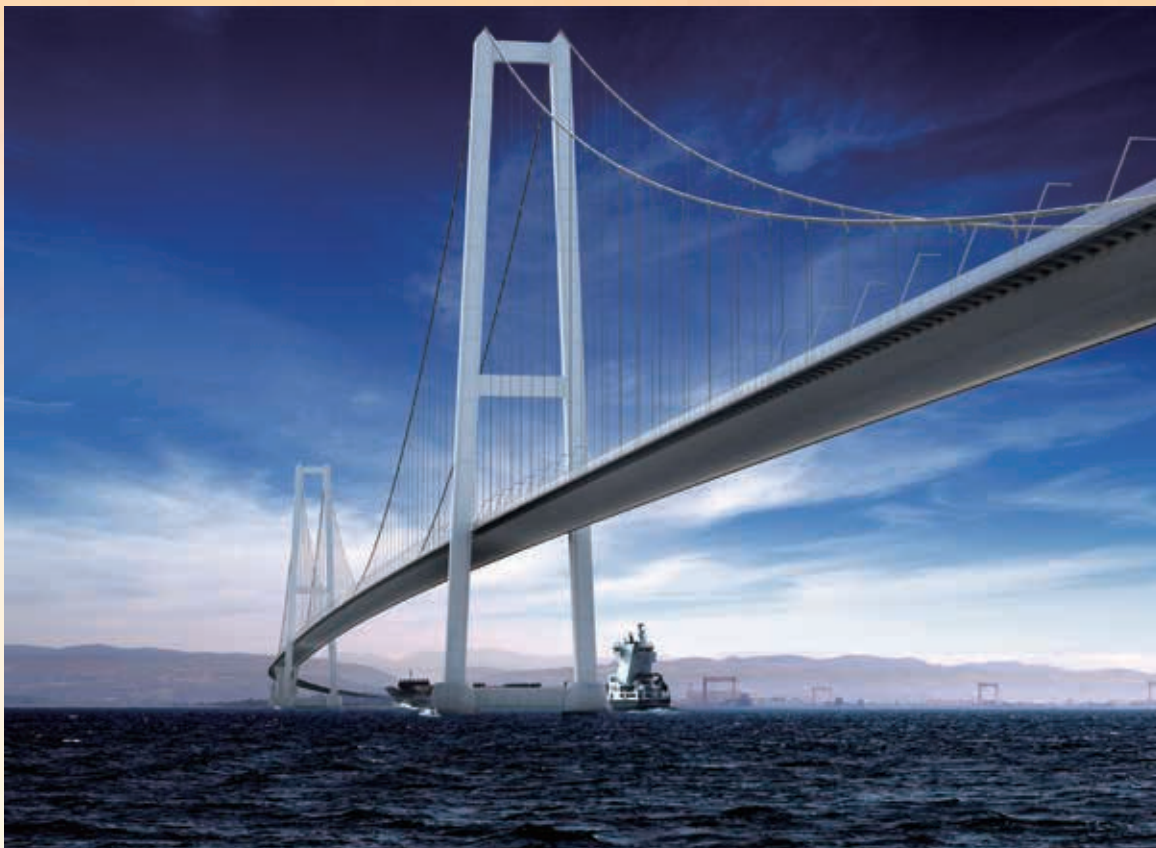
イズミット湾横断橋