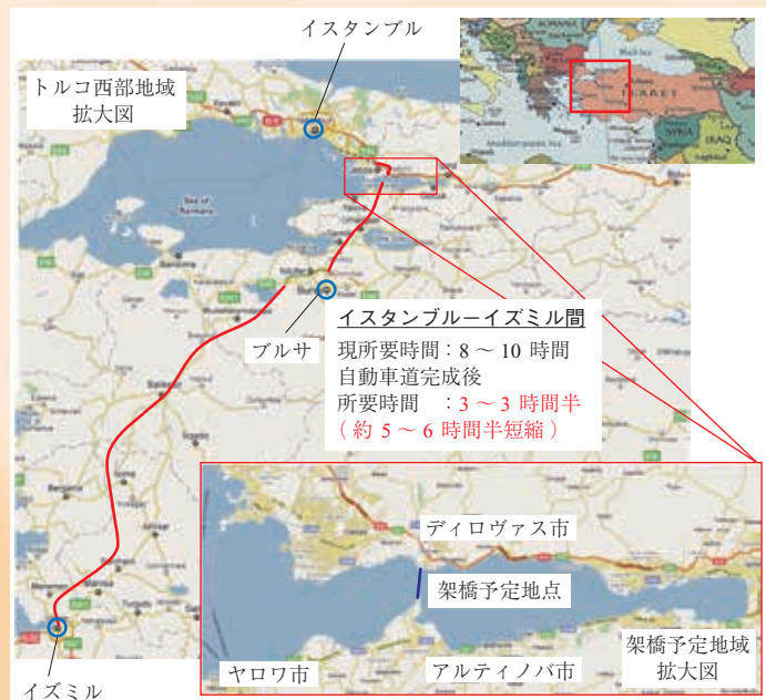
イスタンブルとイズミルを結ぶ自動車道

「本四架橋と私たちの暮らし」(本州四国連絡高速道路株式会社、2009年)にも架橋前は天候による欠航や乗り物酔いや離島意識があったとの記述がある。