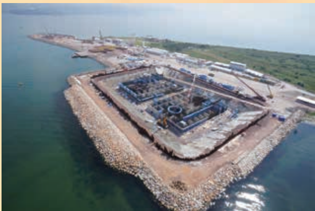
南側建設現場（手前はケーソン製作中のドライドック）

IHI グループが手掛けるプロジェクトとしては 5 番目となる今回のイズミット湾横断橋計画は今を遡ること 20 年前、1994 年にスタートした。しかし、1999 年、架橋地点近くのコジャエリ県イズミット市付近を震源とするマグニチュード 7.6 の巨大地震が発生し、死者、行方不明者 1 万 8 000 人を超える大惨事となった。これと同時に、架橋計画はいったん白紙に戻った。