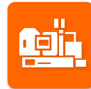
ダイカストマシン

※産業ヒートポンプ、高効率コージェネレーションは申請先が異なるため、ご注意ください。