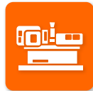
プラスチック加工機械