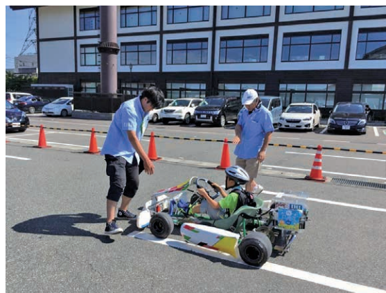
子ども科学フェスティバル（相馬市役所）

きなくなるため、そうまラボでは水素をブースターで加圧したあと、バッファタンクを経由して一定の圧力で各実験セルへ供給する。ブースターは 1 MPa と 10 MPa の 2 系統あり、低圧水素と高圧水素の試験が可能になっている。また、バッファタンクを設置したことにより、ブースターによる圧力変動を吸収し、常時安定した圧力の水素を供給することができる。また、重要なユーティリティ設備として、排ガス焼却処理設備も設置している。実験で合成した物質や未反応の水素は排ガスラインを通り、排ガス焼却処理設備によって安全に処理される。