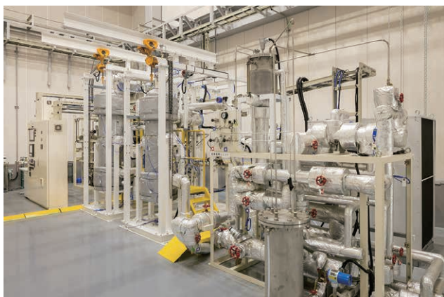
No.1 セルに設置されたメタン合成試験設備