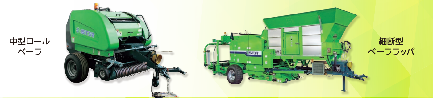
中型ロール ベアラ