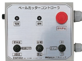
コントロールボックス