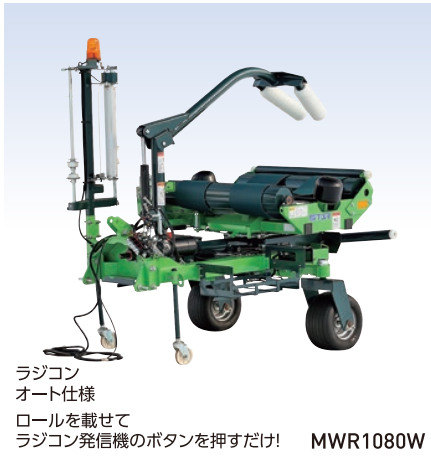
ラジコン オート仕様 ロールを載せて ラジコン発信機のボタンを押すだけ! MWR1080W