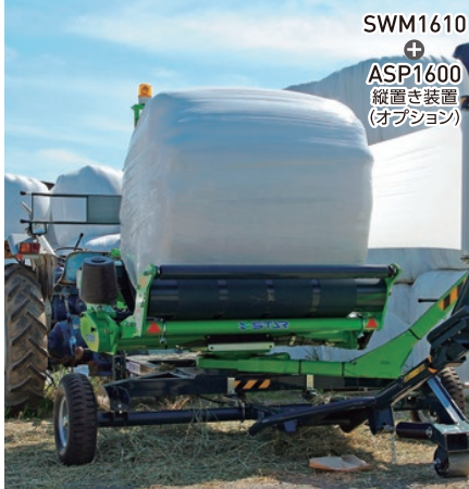
SWM1610 ASP1600 縦置き装置 (オプション)