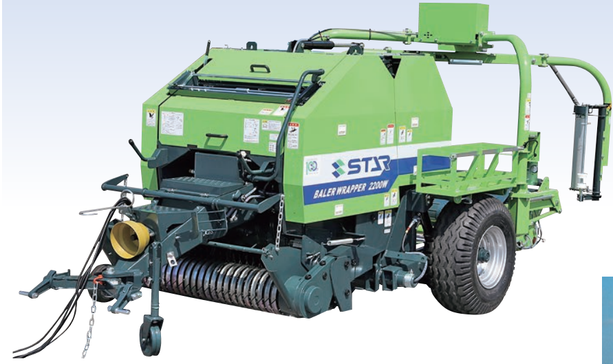
TBW2220WN 中型ベアララップ