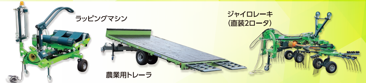
ラッピングマシン