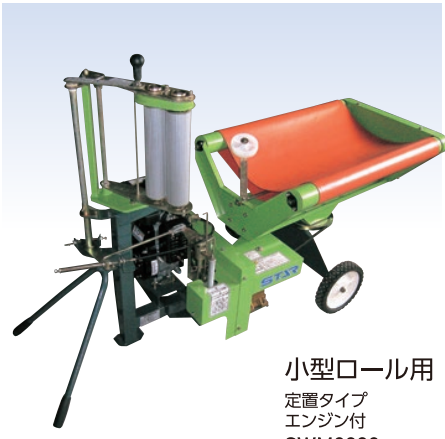
小型ロール用 定置タイプ エンジン付 SWM0830