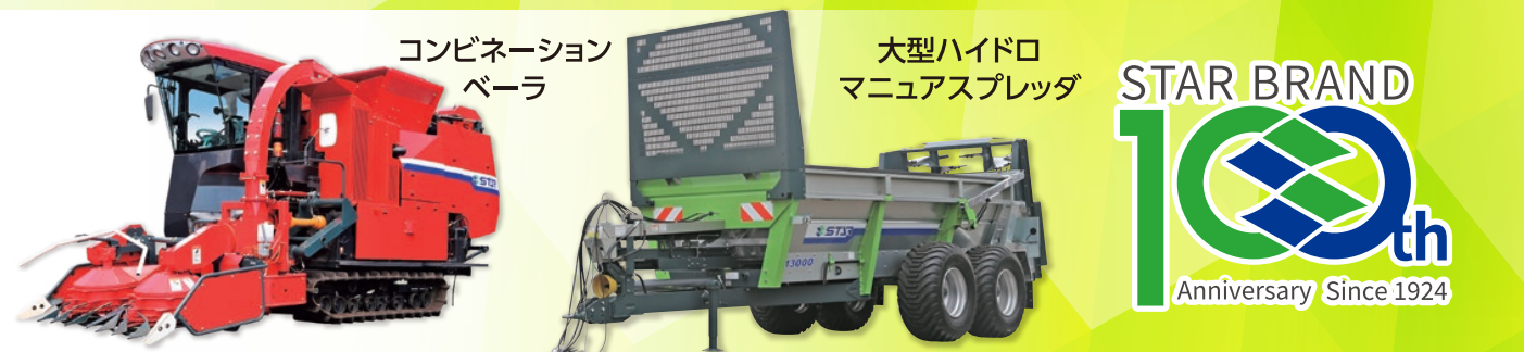
コンビネーション ベアラ