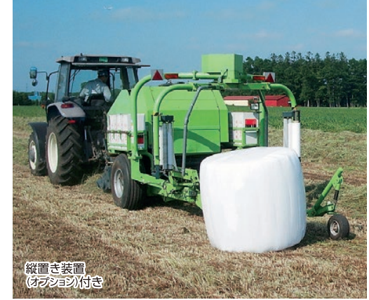
縦置き装置 (オプション付き)