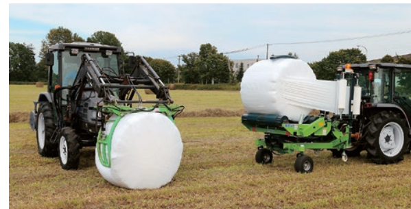
ベールグリッパ(左)とラッピングマシン(右)