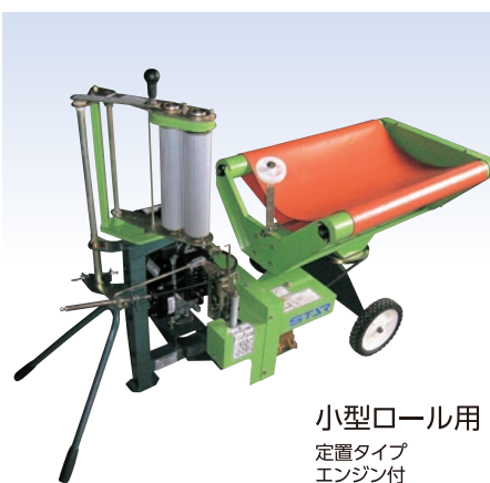
小型ロール用 定置タイプ エンジン付 SWM0830