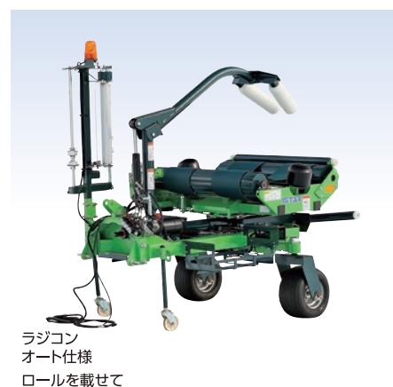
ラジコン オート仕様 ロールを載せて ラジコン発信機のボタンを押すだけ! MWR1080W