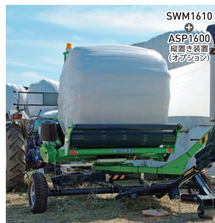
SWM1610 ASP1600 縦置き装置 (オプション)