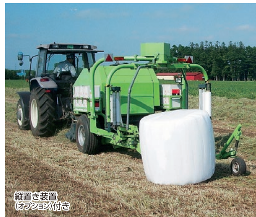
縦置き装置 (オプション付き)

■ほ場からほ場への移動の際は、油圧による機体昇降機構によって車高を上げることができるので安心