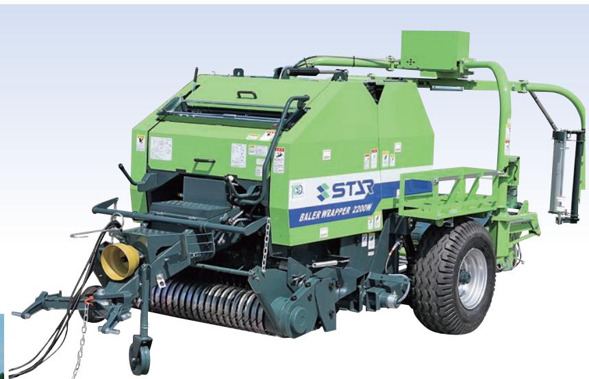
TBW2220WN 中型ベアララッパ