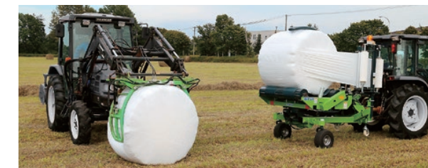
ベールグリッパ(左)とラッピングマシン(右)