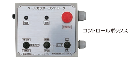
コントロールボックス