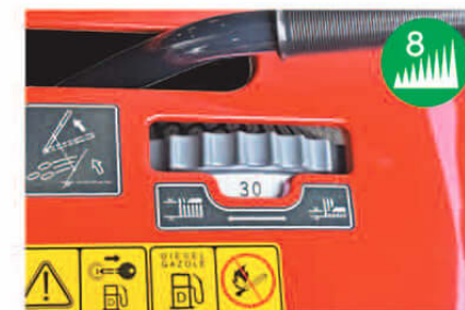
刈高調節は、8段階[30(20*)~120mm]まで設定ができるため、用途・状況に最適な芝生管理が可能です。