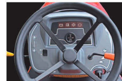
すっきり見やすいステアリング回り。操作を快適にするとともに誤操作を防ぎます。