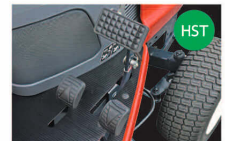
クラッチ操作のいらぬHSTを採用(油圧無段変則)。また、誤操作を防止する前進/後進2ペダル方式を採用しています。