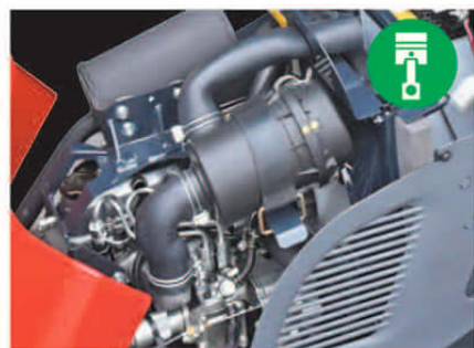
本格派のディーゼルエンジンを搭載。作業に余裕が生まれます。