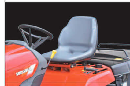
シートは、人間工学に基づいたフィット感を重視した設計。長時間の作業でも疲れを極力抑えます。またスライド調整も可能です。