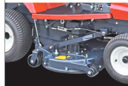
モアの昇降はレバーで行えます。刈刃は2枚、芝を効率良くきれいに刈上げ、スムーズに排出します。