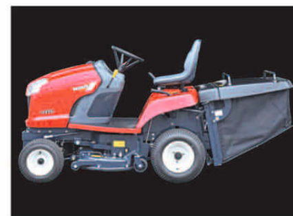
トラクタと集草ホッパーが一体型となったスタイリッシュなシルエット。