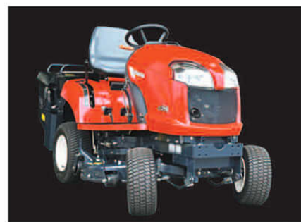
耐久性と高い信頼性の高剛性ボディを採用。