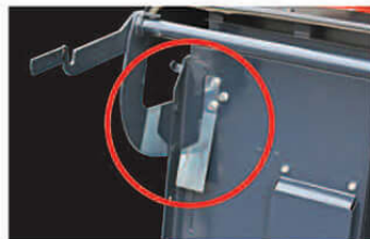
2 ホッパーが本機から離れるとエンジンが自動停止。