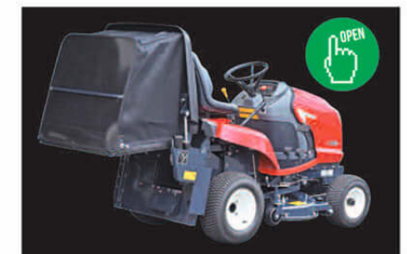
集草ホッパーは、大容量の320ℓ。開閉は電動のため、ワンタッチで行え刈った芝を容易に排出できます。満杯になるとブザーがお知らせします。