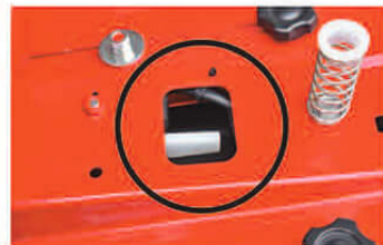
1 運転者がシートから離れるとエンジンが自動停止。

小石の飛散による怪我・事故を防ぐため、刈った芝をトラクタ下部中央から吐き出す『後方排出』を採用しています。 また、『安全停止システム機構』を装備。エンジンフードを開けるとエンジンが停止するなど、万が一の場合にも危険を未然に防ぐよう設計されています。