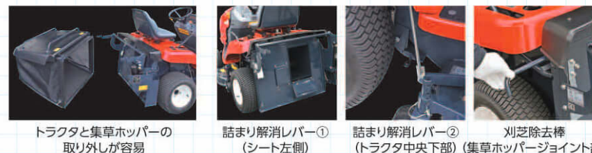
トラクタと集草ホッパーの取り外しが容易