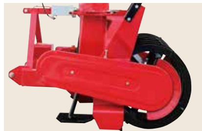
サイドドライブ方式