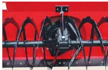
センタードライブ方式

■MSB/1580・1780は、オーバーハングの少ないセンタードライブ方式。 MSB/1880-OS・1650・1950・1951・2300・2301・2550・2750は、強力除雪のサイドドライブ方式。