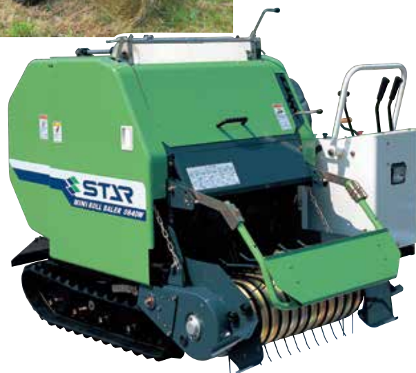
自走カッティングロールベアラ