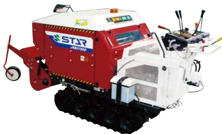
自走ロールベアラ