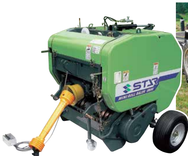
小型ロールベアラ (トラクター用)