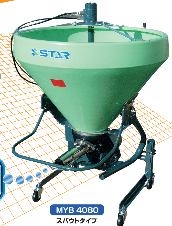
MYB 4080 スパウトタイプ