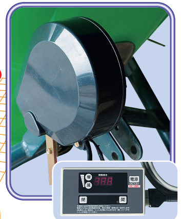
▲コントロールボックス

シャッタ開閉は 手動(型式末尾:0)、 電動(型式末尾:2)から お選び下さい。