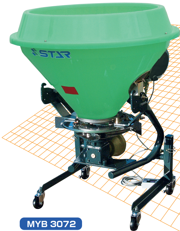
MYB 3072 スピナータイプ