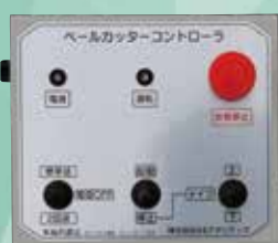
コントロールボックス

スイッチを「2回送」側に倒すと通常時の2倍ベールを送るので、ナイフが深くあたり長切りでも安定して切断できるようになりました。