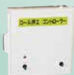
ロール押さえ制御盤 (電動モータータイプ)