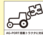
AG-PORT搭載トラクタに対応

※オプション部品のAGポートケーブルで、コントロールボックスとトラクターの信号線をつなぐと、トラクターからの車速信号を利用して散布量を自動調整