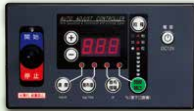
【オートアジャストコントローラ】

*小型ブロードキャストは、GPSナビキャストと異なって、予め設定されたトラクター走行速度等からシャッタ開度を計算しますのでご注意ください。