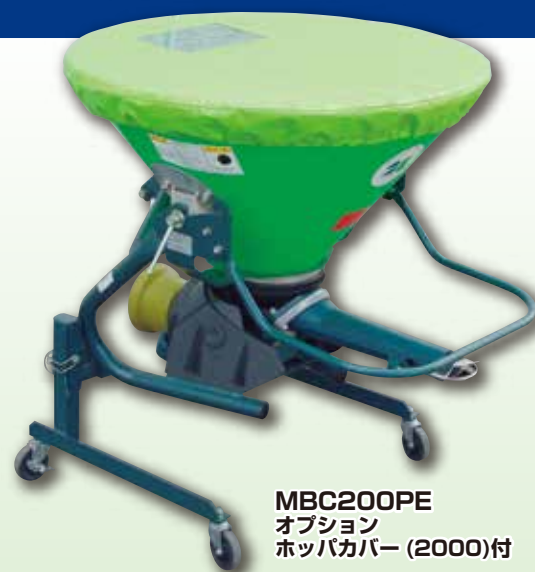
MBC200PE オプション ホッパカバー(2000)付