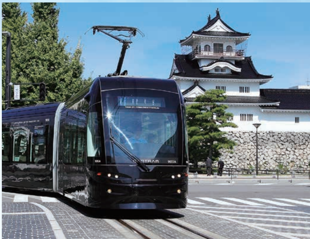
セントラム

富山県は、製菓業をはじめとする安定した地場産業によって、共働き率や勤労者世帯収入などが全国平均を常に上回り、住みやすさランキングなどでもしばしばトップ3に入る。しかしながら富山市は