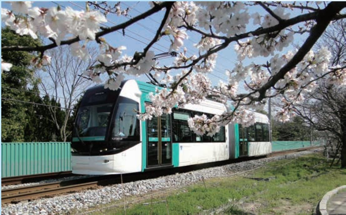
ポートルム

製造を試みている。例えば現在の LRV では、運転席の曲面ガラスの型枠制作ひとつをとっても大きなコストが掛かっているが、設計を標準化し量産することで、低価格な車両が実現可能になる。