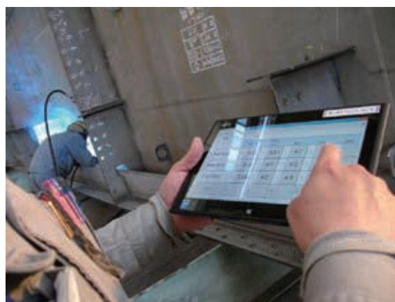
溶接工場での実績情報のリアルタイム入力