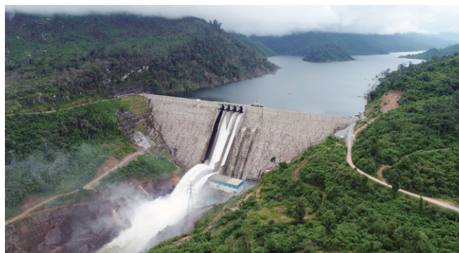
ラオス ナムニアップ1水力発電所 (2019年)