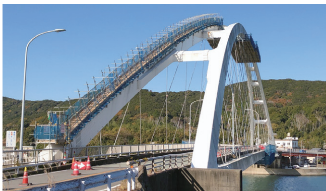
麻生の浦大橋 吊材交換工事 (2023年)