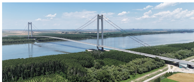
ルーマニア ブライラ橋 (2023年)