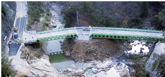
仮橋(トライアス)による災害復旧