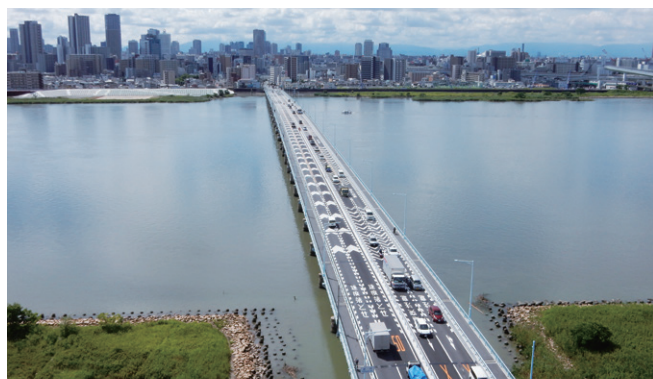
淀川大橋 床版取替他工事 (2020年)