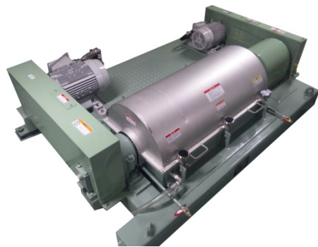
図.2 遠心分離機 ( 外観 ) Fig.2 Centrifuge ( Over view )