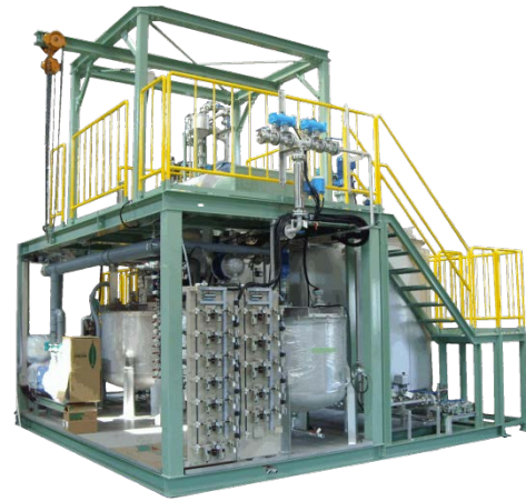
図.1 DSRS-255S ( 外観 ) Fig.1 DSRS-255S ( Over view )

Continuous Si extraction and coolant recovery