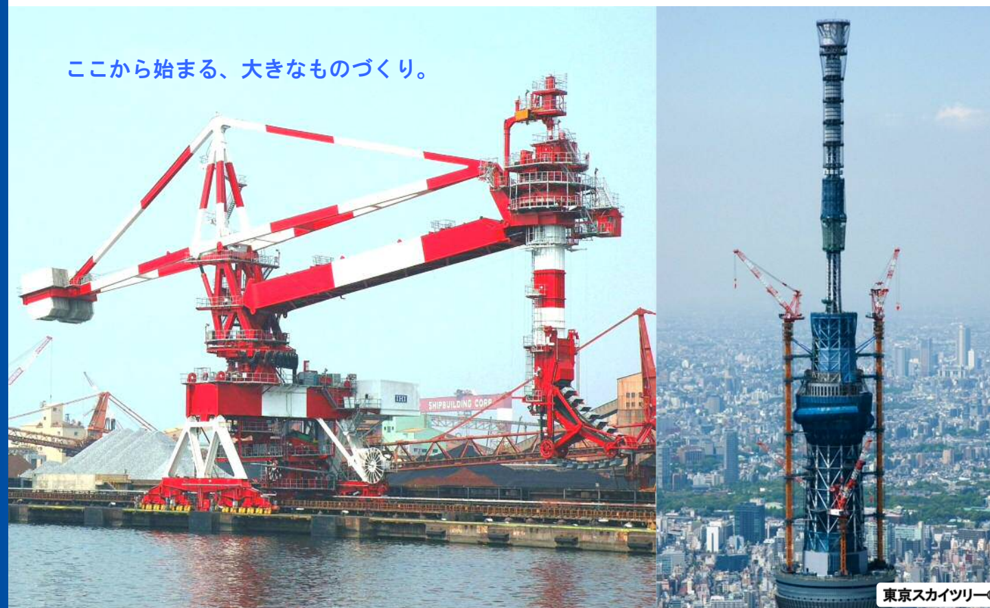
東京スカイツリー®