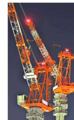
ジブクライミングクレーン