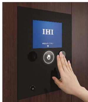
タッチレス操作盤(イメージ)