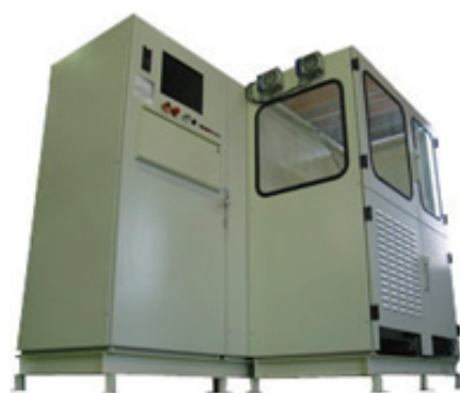
モジュール燃料電池評価装置

地球温暖化対策の要となる CO 2 排出削減において、我が国の排出削減目標達成の一翼を担う燃料電池自動車は、各メーカーの努力によって、国内で 2015 年の普及開始が見えてきた。