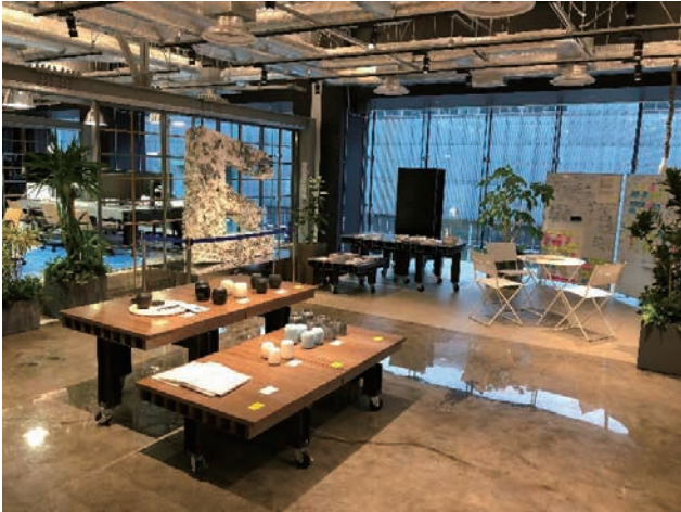
アート作品、デザイン思考の作品を展示した共創エリア