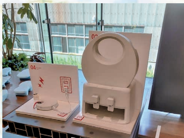
東北芸術工科大学 2018 年度卒業制作作品

いたお客さまに、目指している開発スタイルを理解していただく助けになっています。また、IHIグループ製品、技術を紹介するホームページのデザインにもご協力いただいています。ユーザインタフェースをデザインに取り入れることは、お客さまに継続してご利用いただける製品やサービスの設計につながるものと考えています。