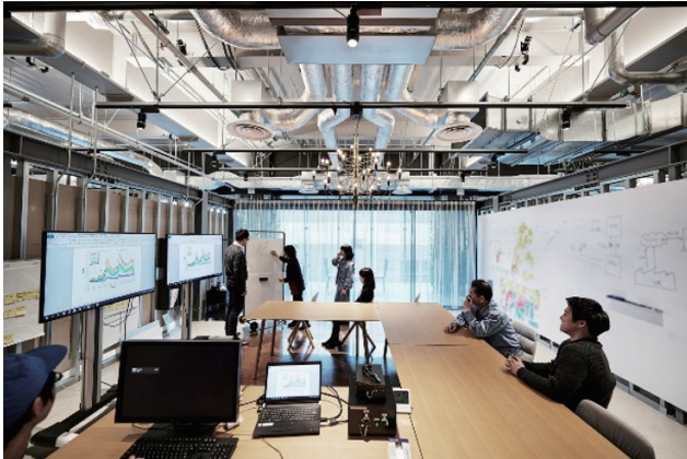
一つの空間で集中して事業化に取り組むプロジェクトブース