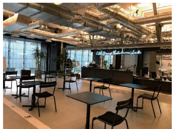
異分野の人が交わり新たな発想を生み出す広場

i-Base は社外の方々の知を取り入れながら前進することをコンセプトにしており、GARAGE もプロジェクトブースも社外や異分野の方々といつでも議論でき