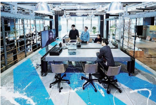
GARAGE でアイデアを伝えるために試作する

隣接する共創エリアのデザイン思考の作品を見ながら、技術実証を目的としてきた試作活動を、デザイン思考のアイデアを絞り込む活動に変えていきます。ここでは、お客さまにご覧いただきながら試作を繰り返していくことで、お客さまのご要望に添ったソリューションを短期間で生み出していきます。