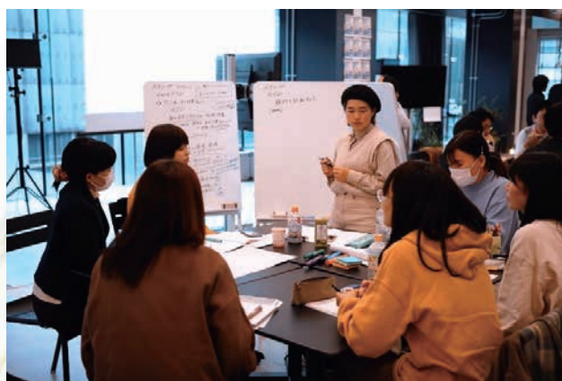
東北芸術工科大学の学生さんとのワークショップ

プロダクトデザイン学科の卒業制作の作品をi-Baseに展示しています。デザイン思考をベースに制作された作品は、お客さまと一緒に試作と検証を繰り返してアイデアを磨いていく開発スタイルの大変良いお手本であり、IHIグループの従業員だけでなく来場いただ