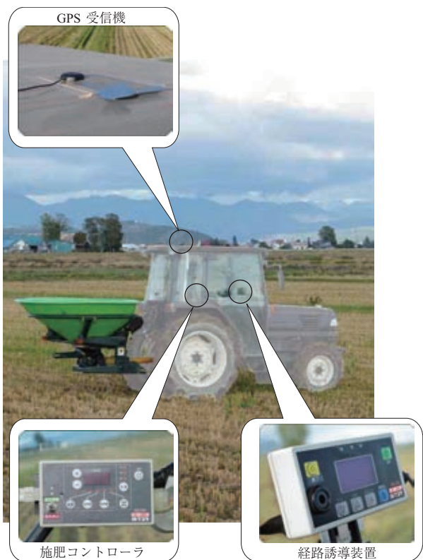
GPS 装置の搭載位置、GPS 装置の設置位置

高速施肥機は、GPS 受信機から得られる速度情報を利用して、トラクタの走行速度に応じた最適な施肥量を常に維持できる。