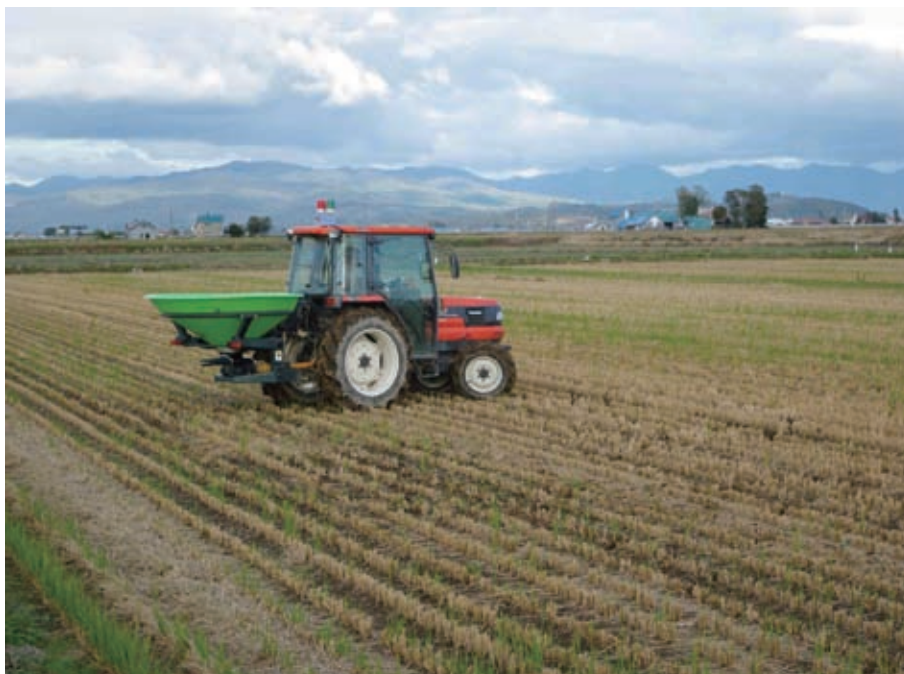
高精度高速施肥機

「高精度高速施肥機」は GPS 受信機から得られる速度・位置情報を利用して圃場（はたけ）で施肥作業を行う農業機械である。これによって、誰にも簡単に施肥作業ができるようになった。