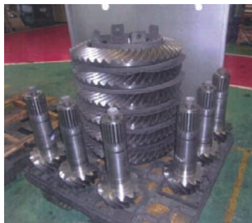
被処理品 (大型ベベルギヤ&ピニオン)

IMS の真空浸炭炉は、真空断熱によって省エネや、緊急時でもガスが放出されない安全性の高さ、作業環境の良好さなどの真空炉の特長をそのまま生かし、浸炭ガスにアセチレンを使った画期的な熱処理設備である。また、熱処理技術熟練者が常駐する必要がなく、全自動無人化の対応や職場環境 3 K (危険, 汚い, きつい) の改善が容易で、空調を完備した工場への設置も少なくない。さらに IMS では、浸炭処理条件の最適化を図り、品質の安定性を高めた。