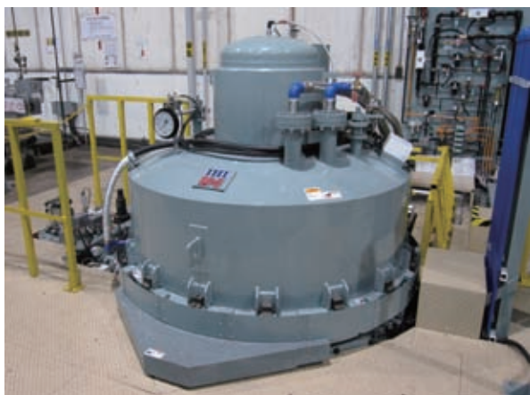
縦型真空浸炭炉 VVCC 外径図

NPS だけでなくいろいろな所で 1 m を超える部品 (工作機械のスピンドルなど) の浸炭処理があり、縦型真空浸炭炉に代替すれば大きく省エネできる。