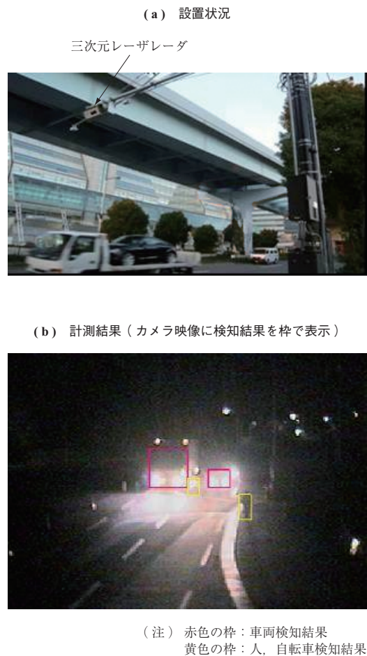
第2図 設置状況と計測結果 Fig. 2 Installation status and measurement results

本装置は、踏切内の自動車などを検知して、踏切障害物として信号機を発光させ、列車の乗務員に通報する。従来装置ではできなかった対象物の大きさや移動方向の把握が可能で、線路脇に取り付けるだけなので、設置工事とメンテナンスが容易である。