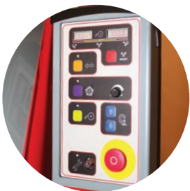
直観式のコントロールパネルにより一貫した操作が保証されます