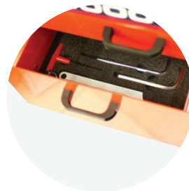
工具や部品を保管するための収納引き出し