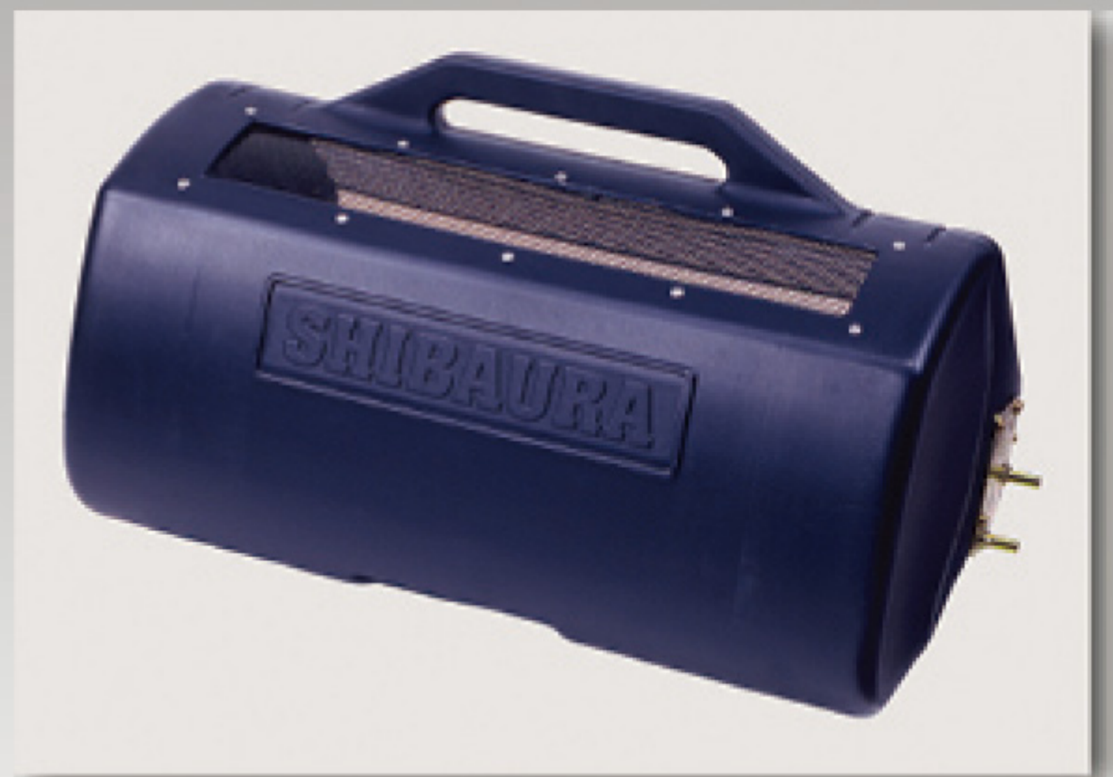
取手付バケット(標準装備)