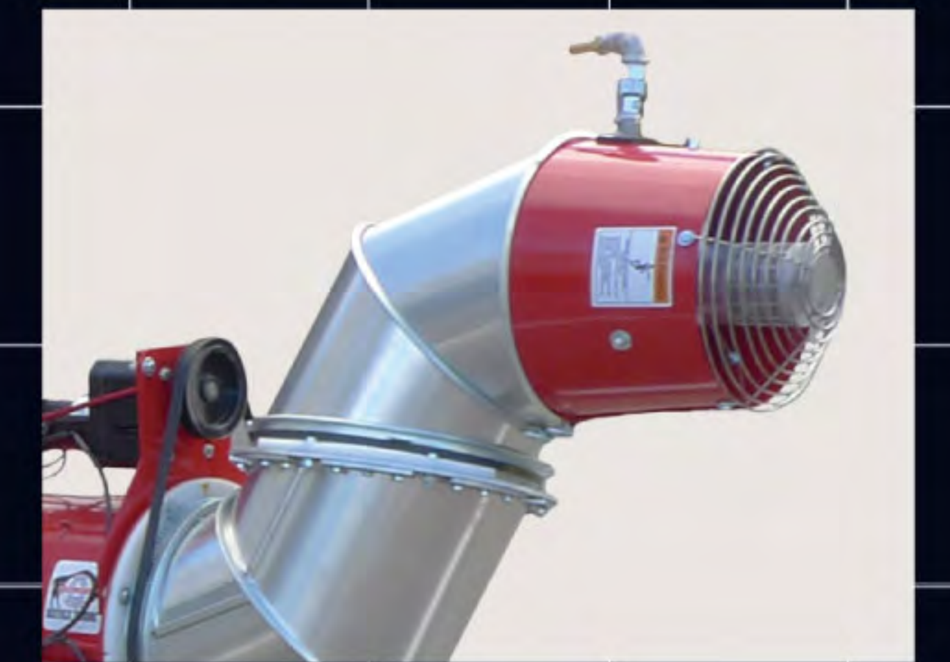
ターボスパウダ TBL-MON ※TBL283-MC用アタッチメント (最大到達距離:水平方向40m、垂直方向25m)