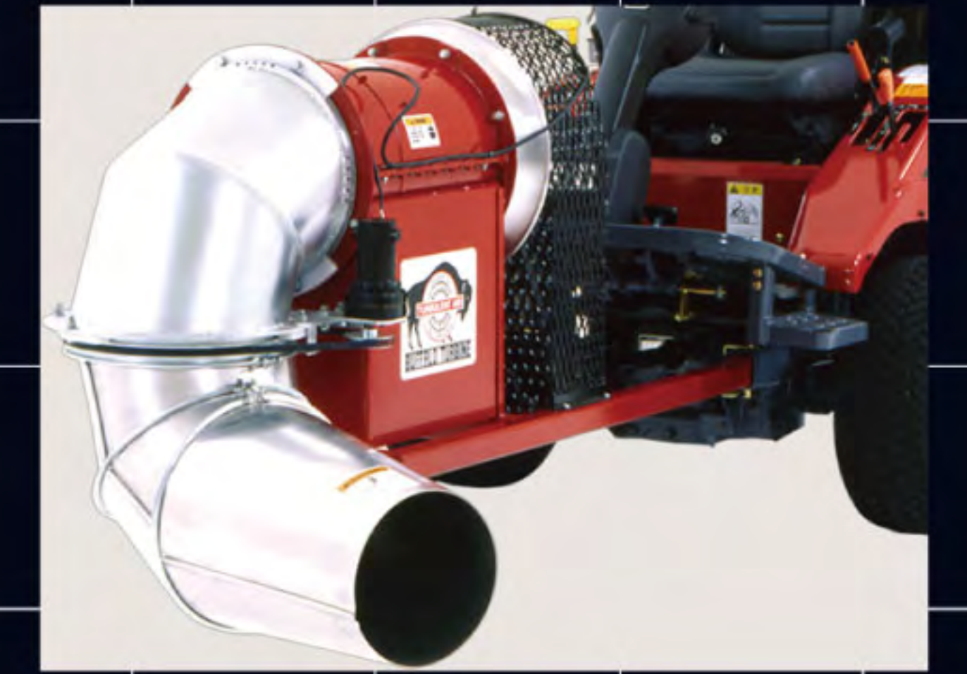
ターボブロウ TBL283-MC 風量:283m 3 /min